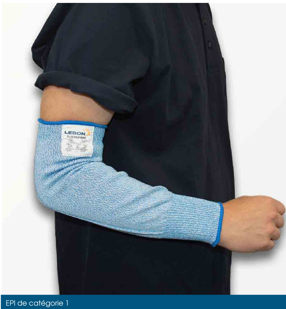
EPI de catégorie 1